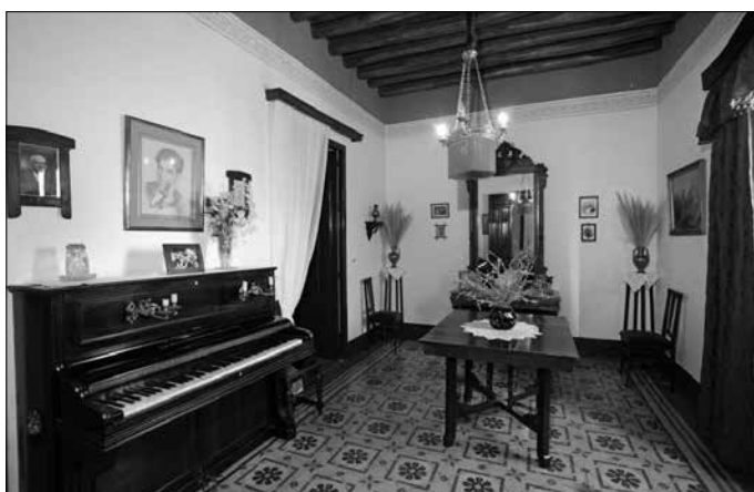
2. Casa de la familia Lorca en Valderrubio.