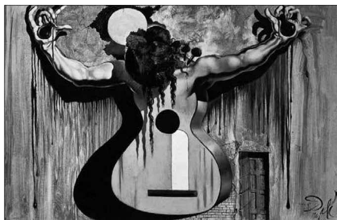
4. Salvador Dalí, proyecto para el telón de Café de Chinitas , 1943. Fundació Gala-Salvador Dalí.

Por último mencionar la representación como telón de fondo de la guitarra que Dalí realizó como homenaje a Lorca. Un día el marqués de Cuevas le dijo a Encarnación, “La Argentinita”: « te quiero hacer un regalo ¿te gustaría que Dalí te hiciera un retrato? », a lo que ella respondió que prefería que le hiciera un decorado homenaje a Federico. El decorado para El Café de Chinitas de Dalí, para representarlo en el Metropolitan de Nueva York, presentaba una gran mujer-guitarra sobre una tapia de fusilamiento por donde resbalaba la sangre derramada que fluía de las heridas de las castañuelas.