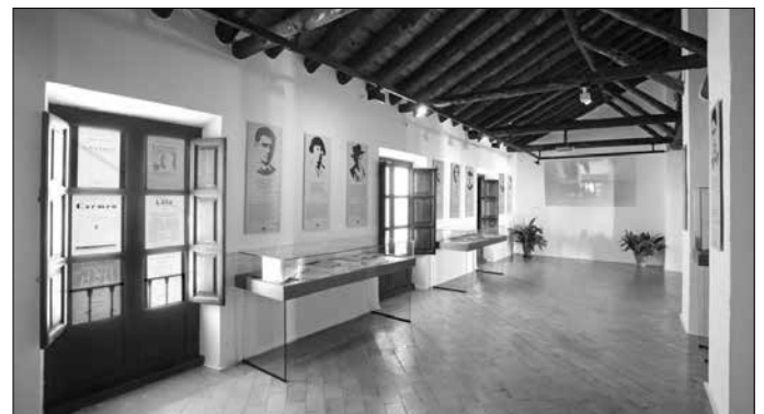
1. Museo casa natal de Federico García Lorca en Fuente Vaqueros. Granero, actual sala de exposiciones temporales.

Podemos pensar que la técnica rasgueada para acompañar canciones la aprendió en el ambiente familiar, pero sus conocimientos musicales y pianísticos le llevarán posteriormente a ampliar su técnica y repertorio.