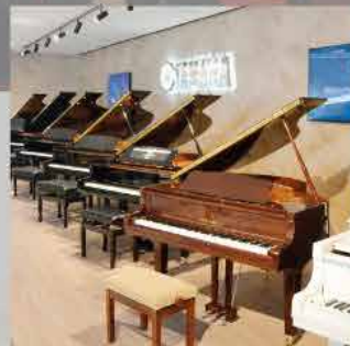
PIANOS DE COLA

1.000 m2 DE EXPOSICIÓN REFERENTE A NIVEL NACIONAL