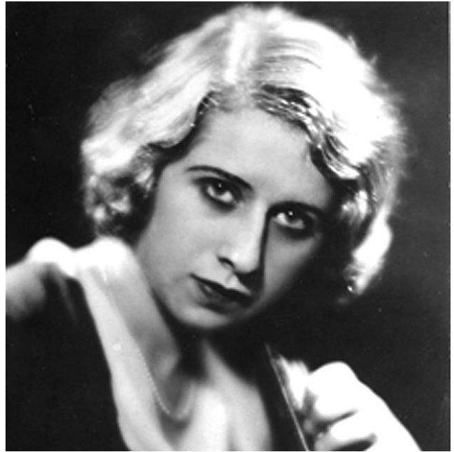
Raya Garbousova en 1939

En este breve espacio es difícil que podamos hablar de cada una de ellas, por eso nos gustaría traer aquí cuatro figuras representativas para valorar sus méritos y las impresiones que causaron en su tiempo. Queremos que sea el primer ejemplo el de la violonchelista georgiana Raya Garbousova (1906-1997), por ser la primera violonchelista que actuó en Málaga. Garbousova estudió con Hugo Becker y más tarde con Felix Saldmon y Pau Casals. Maréchal definió así su estilo interpretativo después de haber asistido a un concierto suyo en París en 1937: "Sin fatiga, sin esfuerzo, con encanto infinito, el sonido de una pureza absoluta, ¡y una facilidad en la mano izquierda que envidiarían los jóvenes estudiantes de nuestro viejo conservatorio! Y eso, sin perseguir efectos llamativos, sin el más mínimo error de gusto, de una integridad musical simplemente impecable." 1 Garbousova actuó en Málaga en dos ocasiones, en su primera actuación, la de 1928, dentro de la segunda gira que realizaba la violonchelista por las sociedades filarmónicas de España, esta fue la sensación que causó en el comentarista de La Unión Mercantil :